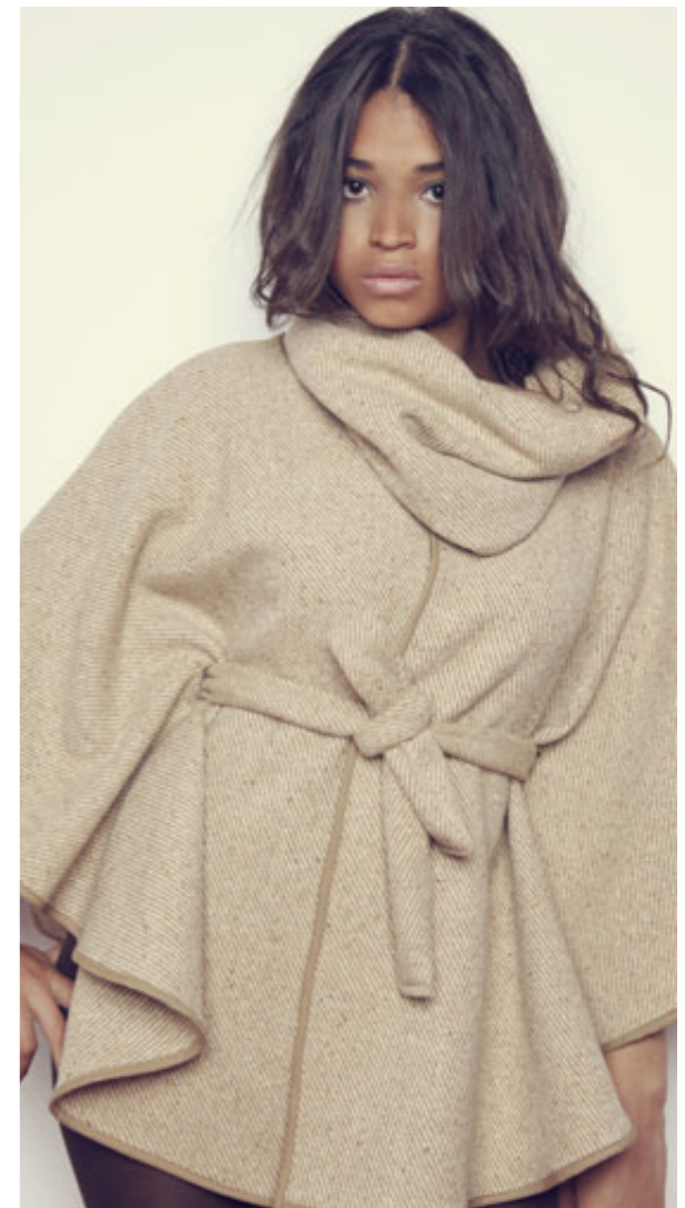
CAPA: CNS08 CUELLO: CNA20 BOLSO: CNA21