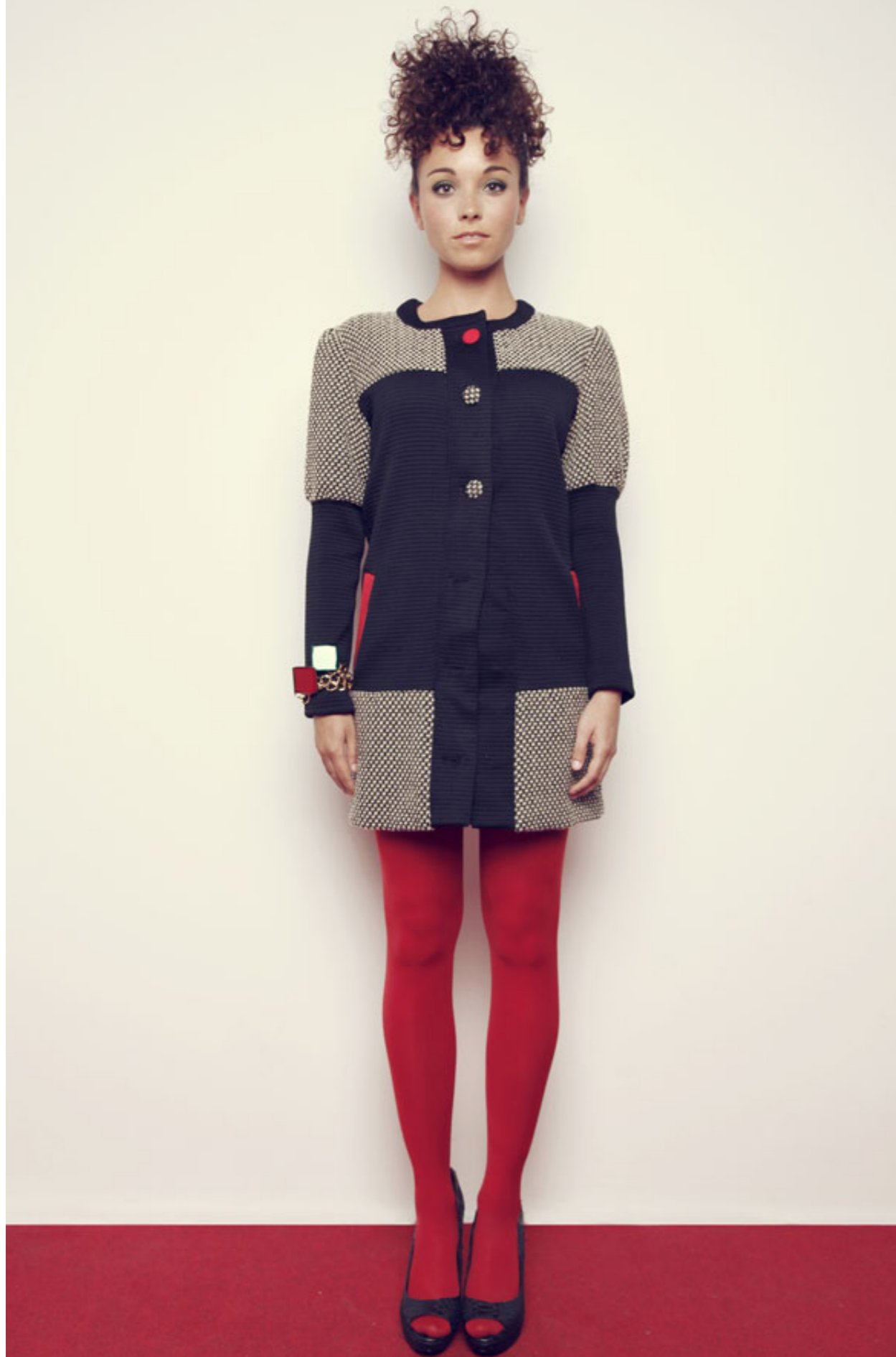
ABRIGO: CNS03 PULSERA: CNA12